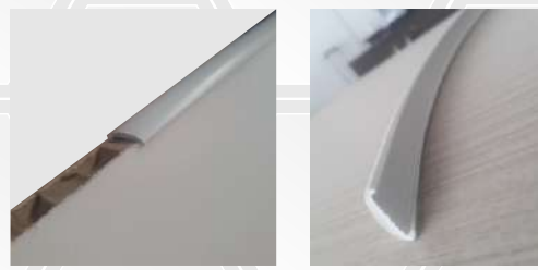
Ecoboard com perfil Hexacell

As cores padrões são branco e preto. Outras cores são disponíveis a pedido, respeitando o lote mínimo.